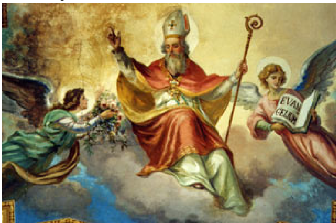
Chiesa parrocchiale di S.Sabina in Trigoso, affresco del Santo (anonimo XIX sec.) dipinto nella volta della cappella di San Gottardo.